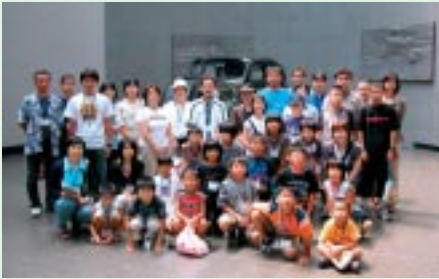
トヨタ初の乗用車(トヨタAA型乗用車・1936年)の前で記念撮影(トヨタ博物館)

往復の高速道路では、パーキングエリア「サービステリア」間を利用し、新型車「ポルテ」の試乗を実施。「車内が広くて快適」「狭い駐車場はスライドドアが便利」など好評でした。岡山での解散時には、「来年も参加したい」「大人になったらトヨタの車に乗る」などの声を多数いただきました。トヨタの「人と地球にやさしい高品質な車づくり」を体感し、未来の車に夢を膨らませていただけたようです。