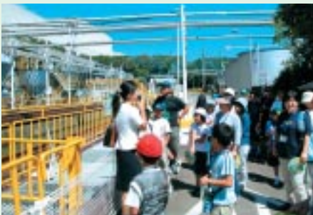
高岡工場の「クリーンアクアセンター」