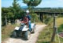
さなげアドベンチャーフィールド