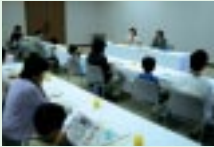
トヨタ会館での懇談会