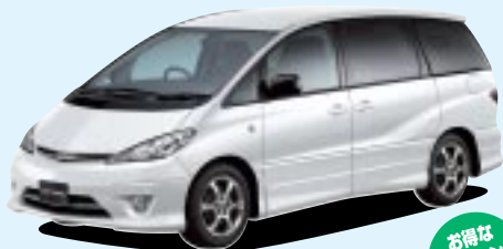
■エスティマT ●2400J 2WD 8人乗り 240.975万円 (税込) ～3000Gレザーセレクション 4WD 7人乗り 397.95万円 (税込)