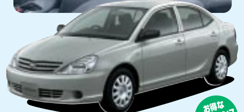
■アリオン ●A15 167.475万円 (税込) ～A20 Sパッケージ 217.35万円 (税込) ※4WDもごさいます。