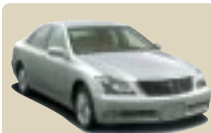
クラウンロイヤル

より手軽に、細やかに 初回車検前までの3年間 基本メンテナンスを サポートいたします。