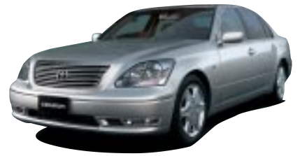
■セルシオ ●A仕様 593.25万円 (税込) ～C仕様 Fパッケージ インテリアセレクション 787.5万円 (税込)