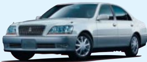
■クラウンマジェスタ ●3000 Aタイプ 451.5万円 (税込) ～4000 Cタイプ 538.65万円 (税込) ※4WDもごさいます。