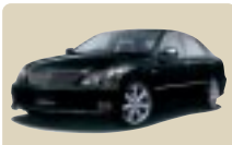
クラウンアスリート