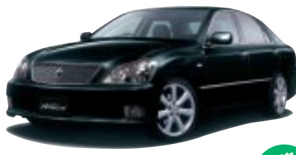
■クラウンアスリート ●2500 367.5万円 (税込) ～3000 Gパッケージ 514.5万円 (税込)