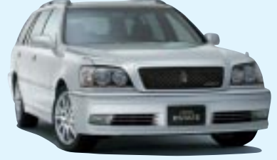
■クラウンエステート ●2500 アスリート 372.75万円 (税込) ●3000 アスリートG 441万円 (税込) ※4WDもごさいます。