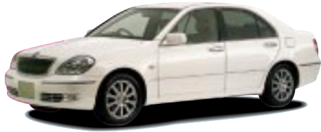
■プレビス ●Ai 250 353.85万円 (税込) ●Ai 300 395.85万円 (税込) ※4WDもごさいます。