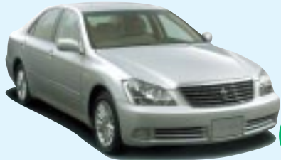
■クラウンロイヤル ●2500 ロイヤルエクストラ 330.75万円 (税込) ～3000 ロイヤルサルーン G 493.5万円 (税込) ※4WDもごさいます。