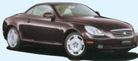
■ソアラ ●4300cc 630万円 (税込) ●ノブカラーエディション4300cc 661.5万円 (税込)