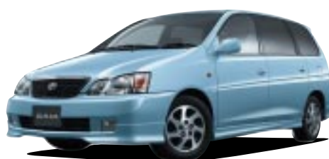
■ガイア ●2000cc 2WD 標準 208.95万円 (税込) ～2000cc 4WD Gパッケージ 279.3万円 (税込)