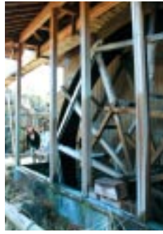
大きな水車が回ります。建物内部では製粉を行います。