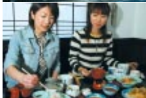
メニューはごちそう膳から井ものまで