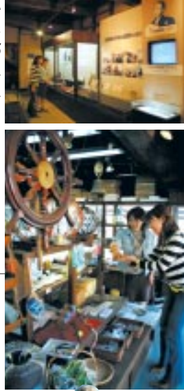
いろは丸のあれこれ かわいいグッズもある船員店 展示

▼084・983・5661 / 入館200円 / 10時~16時30分 / 年末年始休館