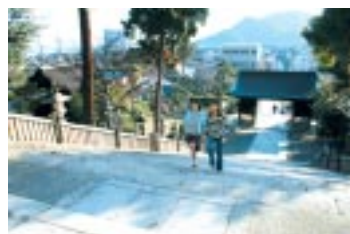
沼名前神社の階段にふう