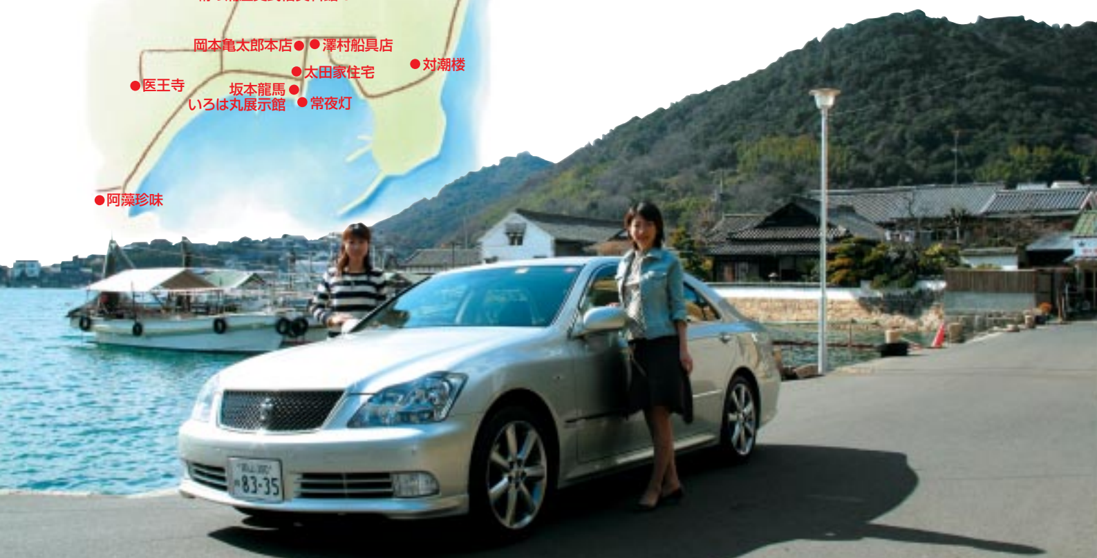
鞆の浦の春は潮風が心地よい