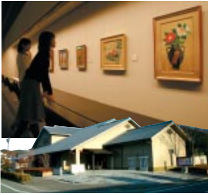
日本画の美にしみじみ見とれる

▼井原市高屋町537-1 / 08666-67-2225 / 9時〜16時30分 / 入館500円 / 月曜休館(祝日の場合翌日) http://www.takaya.co.jp/hanatori/museum.html