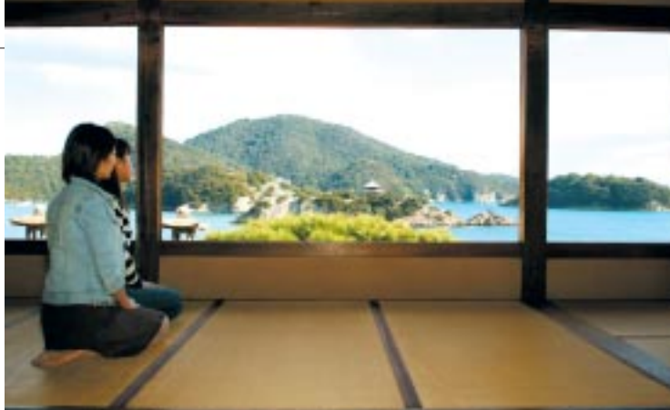
まさに値千金の眺望

海岸山千手院福禪寺は、平安時代創建と伝えられる真言宗寺院。本堂に隣接する対潮楼は、江戸時代の元禄年間（一六九〇年ごろ）創建の客殿で国の史跡。座敷からの眺めはすばらしく朝鮮通信使が「日東第一形勝」と賞賛しました ▼084-982-2705 / 入館200円 / 無休