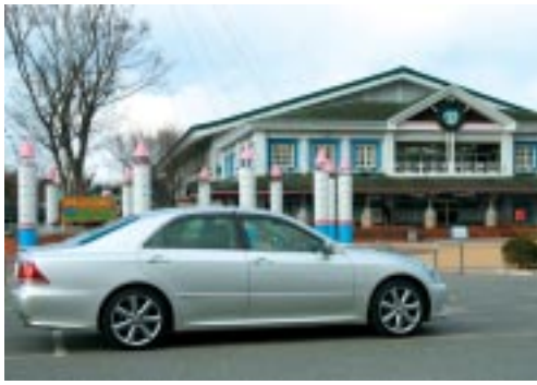
とっても快適な新型クラウンでした