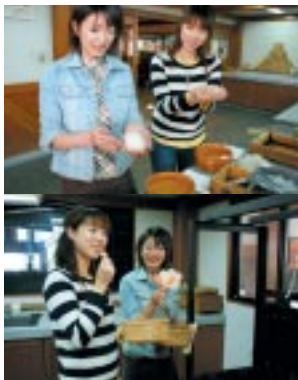
鯛ちくわづくりを体験

▼福山市鞆町後地 1567-1 / 084-982-3333 / 9時～16時30分 / 月曜休 (祝日の場合翌日) / 入館無料 / 体験価格 鯛ちくわ一本160円を http://www.amochimi.com/