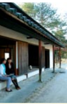
吉備路の街道茶屋で