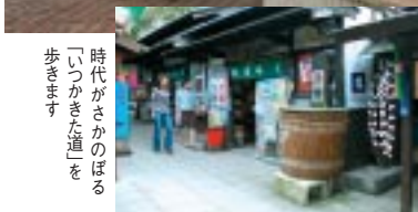
時代がさかのぼる「いつか来た道」を歩きます