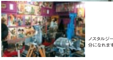
ノスタルジックな気分になります