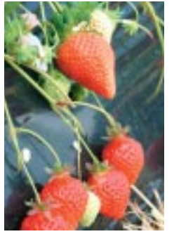
矢掛のイチゴはとっても甘い隠れた名産品です