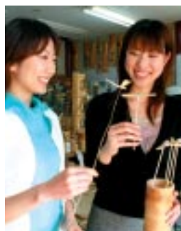
真備町の竹工房で...

▼真備町前田 / 0866-98-1111 (真備町役場農林経済課 / 10時～16時 / 月曜休 / 見学自由 http://www.town.nabi.okayama.jp/