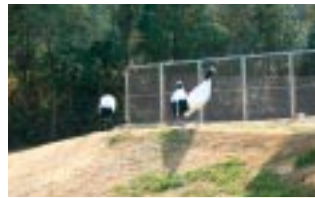
サンロード吉備路に隣接する吉備路つるの里は見学自由