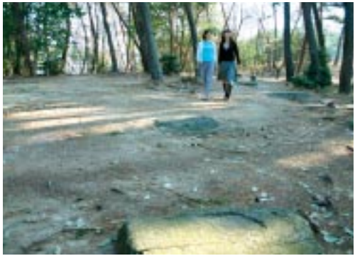
古代の礎石がそのまま残っている国分尼寺