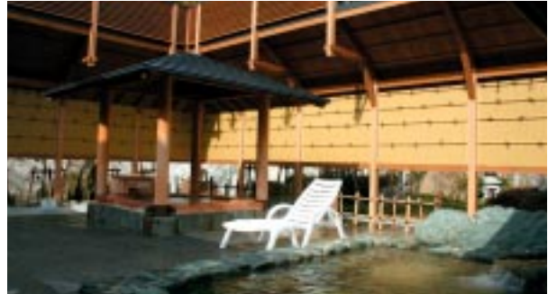
湯の華の香りが漂うサンロード吉備路の新温泉