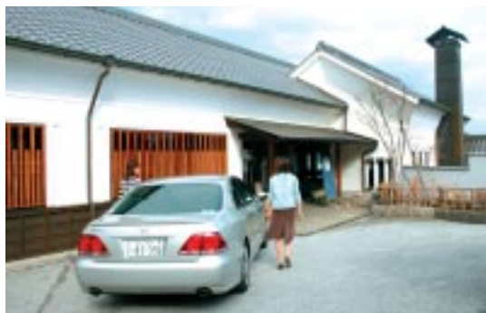
鯛ちくわで有名な「うをの里」

鞆の浦の町を後にして沼隈方面へ。途中、鞆の浦を望む山腹にある阿藻珍珠職人館に立ち寄りしました。ここでは、手にぎり鯛ちくわづくりなどのいろいろな体験が楽しめます。建物は、瓦葺き、漆喰の白壁の造りで江戸期の浜の蔵屋敷のよう。もちろん水産加工品の製造工程の見学や買い物も楽しめます。