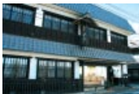
海鮮料理が美味しい衣笠

▼福山市鞆町 150-12 / 084-983-5330 / 11時30分～14時、17時30分～21時 (日曜、祝日は休憩無し) / 水曜休 (祝日の場合翌日) / 四季定食1800円、鯛づくし膳3000円、おつくり定食1300円