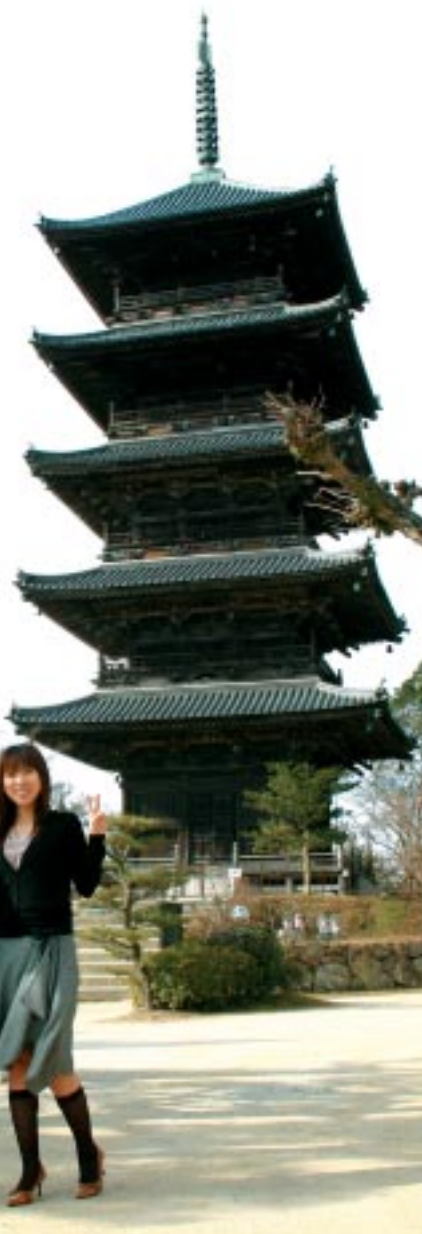
吉備路のシンボル備中国分寺五重塔