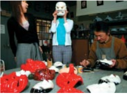
神楽面の工房におじゃましました

▼総社市三須 796 / 0866-93-2164 / かべら面・一万円ぐらいかし http://www.kotnejp.kagura/