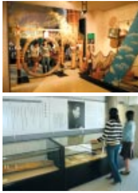
鞆の民俗文化を紹介 宮城道雄愛用の箏を見学

▼084・982・1121 / 福山市鞆町後地5361 / 9時~16時30分 / 入館150円 / 月曜休館(祝日の場合は翌日)