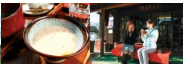
くろひめ亭名物の「赤米の甘酒」 あー、美味しい