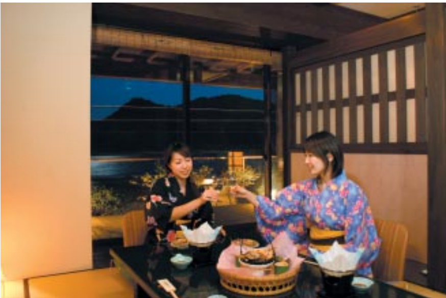
料理だけでなく風景も美しい鞆の浦の宿景勝館 漣亭

▼福山市鞆町鞆421 / 084-982-2121 / 1泊2食付12000円 http://www.tomo-skole.co.jp/keisho/