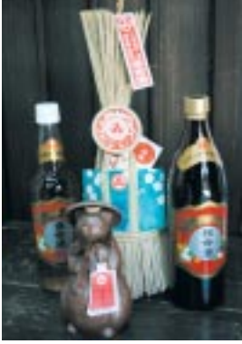
太古の昔から造り続けられているという保命酒

▼084・982・2126 / 9時~18時 / 無休 http://www.honke-hounaishu.com/