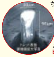
これが氷をひっかく ビッググラスファイバー

氷上でタイヤが滑る主原因は水。その水を効果的に除去するため、撥水ゴムのベースに「グラスファイバーゴム II」を開発。右下の拡大写真は「ビッググラスファイバー」で、従来のものに比べて3倍の太さを持ち、より深く氷をひっかきます。